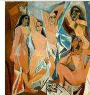
Les demoiselles d'Avignon