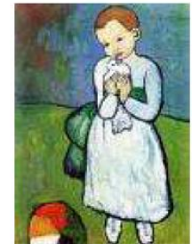
L'enfant au pigeon