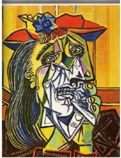
La femme qui pleure